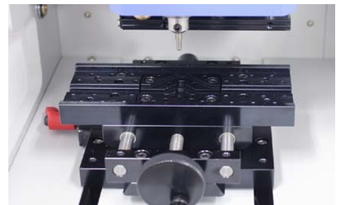
Morsa autocentrante per targhette e oggetti con superfici anche non piane

PRIMO GR20 dotato di sistema di fissaggio del pezzo intercambiabile